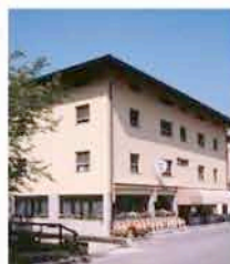
ALBERGO • RISTORANTE • PIZZERIA