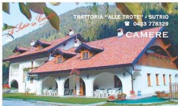
TRATTORIA "ALLE TROTE" - SUTRIO ☎ 0433 778329